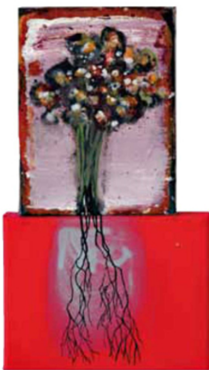
Afrikaner 979 Mischtechnik auf LW · 15 x 20 cm