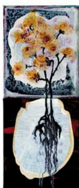
Afrikaner 996 Mischtechnik auf LW · 60 x 25 cm

Angespülte Schicksale. Weit weg von meiner Geschichte und doch so nah. So traurig, tragisch. Und ... stopp – denn die Medaille hat zwei Seiten. So ist dein Lachen meins, so weit weg und doch so nah. Und bringe mich ein, reiche eine Hand, mache mein Herz auf.