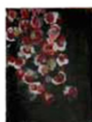
Afrikaner 960 Mischtechnik auf LW · 15 x 20 cm