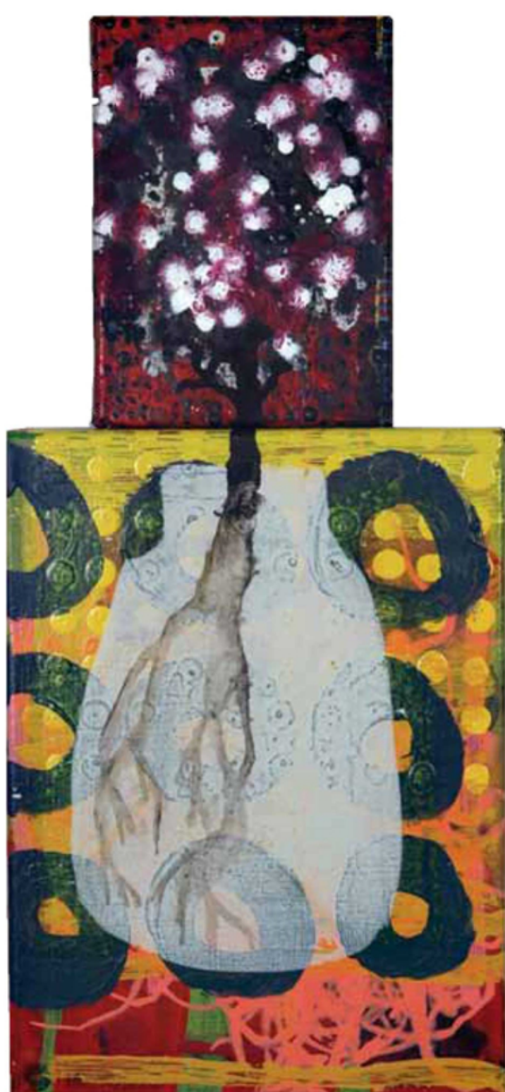
Afrikaner 977 Mischtechnik auf LW · 20 x 15 cm